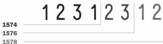
Medida de caracteres: 7mm