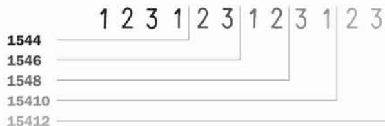
Medida de caracteres: 4mm