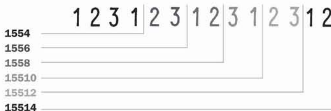
Medida de caracteres: 5mm